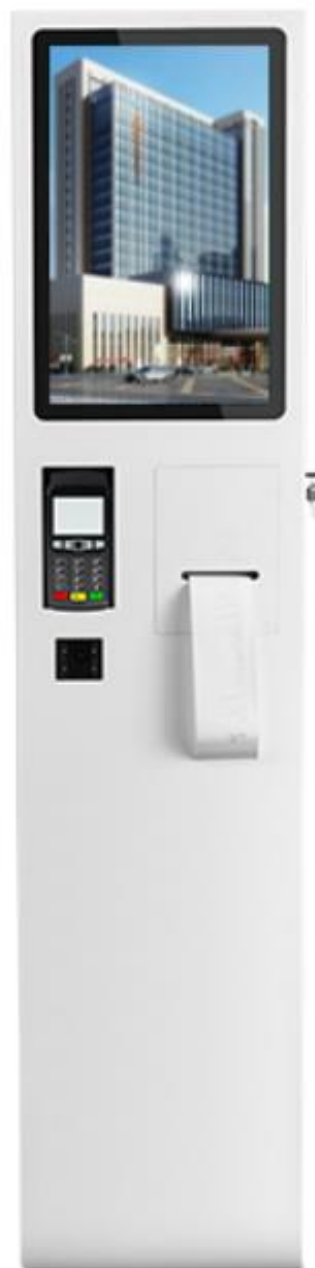
1. widok czołowy urządzenia