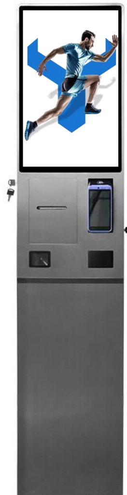
1. widok czołowy urządzenia